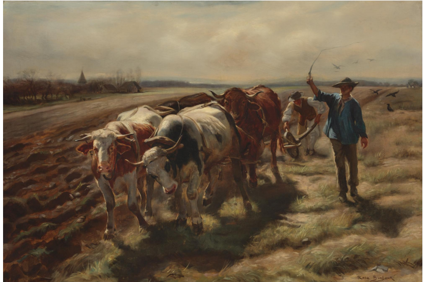
Rosa Bonheur (1822–1899), Charrue à boeufs , 1875, huile sur toile, Collection privée.

Observe en premier lieu ces trois œuvres réalisées au XIX e siècle et au début du XX e siècle :