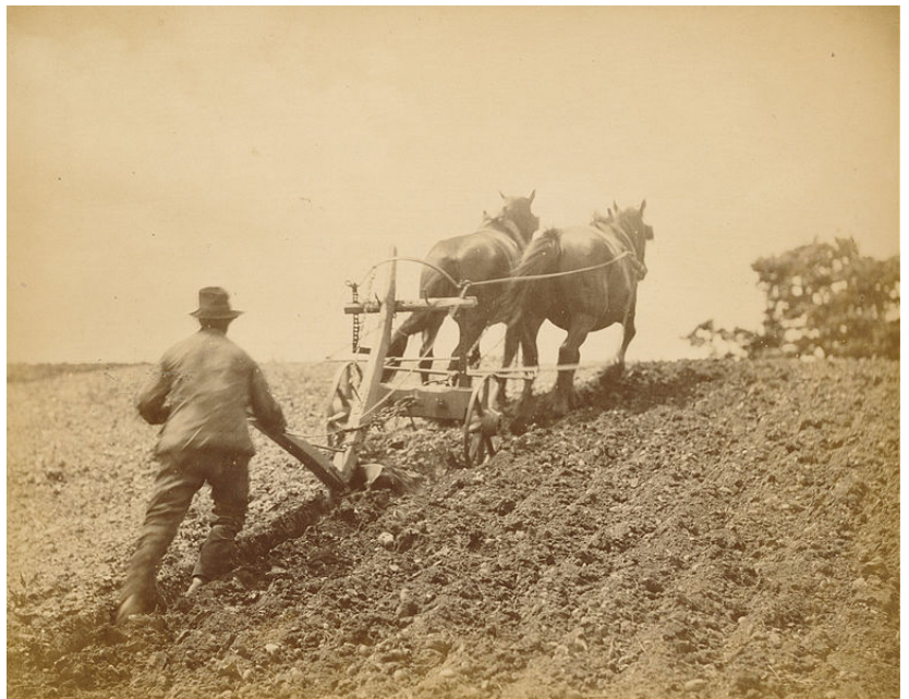
Peter Henry Emerson (1856 - 1936), A stiff pull, 1895, photographie